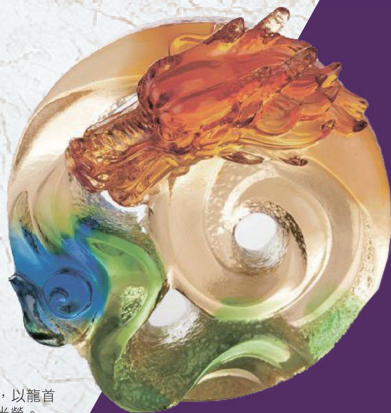
本次高杏獎特別選用<尊龍>琉璃，以龍首為意象，顯現獲獎者至尊無上的光榮。